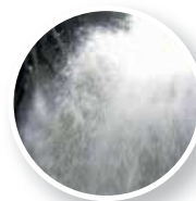
cca 3–5% voda